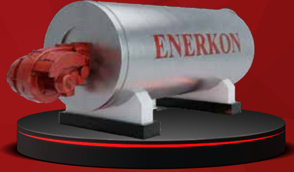
KIZGIN YAĞ KAZANI