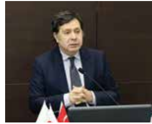
Ticaret Bakanlığı Uluslararası Anlaşmalar ve Avrupa Birliği Genel Müdür Yardımcısı Atilla Bastırmacı

Kıvanç, özellikle Avrupa pazarına erişimde menşe kurallarının kritik rol oynadığını belirterek, bu kuralları "Ticari