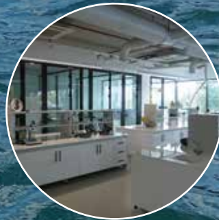
Akredite Laboratuvar Analizleri