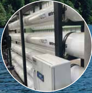
Ham Su Arıtma Sistemleri