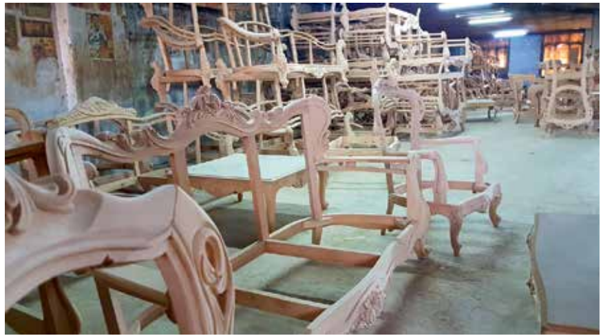
Adana İhtisas Mobilya Sanayi Sitesi (ADAMOS) kapsamında 569 metrekareden 6 bin metrekareye kadar uzanan modern üretim alanları faaliyete geçerken, kurulacak eğitim tesisleriyle sektörün ara eleman ihtiyacının karşılanması hedefleniyor.

eğitim okulu ve sanat okulu planlıyoruz. Burada eleman yetiştireceğiz, sektörün ara eleman ihtiyacını karşılayacağız.” ifadelerini kullandı.