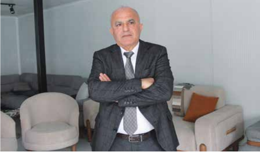
Bıldırın, Adana'da kayıtlı ve kayıt dışı yaklaşık 2 bin mobilya işletmesinin alan yetersizliği ve markalaşma eksikliği sorunlarını bu proje ile çözüp, ADAMOS ile üretim kültürünü modernleştirerek 10 bin kişilik nitelikli istihdam yaratmayı hedeflediklerini belirtti.

şu anda kendi üretimimizi yapıyoruz. Markalaşma yolunda bu projeye başarılı olacağımıza inanıyoruz. ADAMOS ile üretim kültürü değişecek. Seri üretime geçtiğimizde, AR-GE merkezimizde tasarıma odaklandığımızda Adana'dan dünya markaları çıkacak. Orada çalışacak 10 bin kişi, nitelikli iş gücü olacak. Mesleki eğitim okulumuzda yetiştireceğimiz gençler, sektörün geleceğini inşa edecek. Seri üretim, planlı üretim ve organize üretim de mobilya sektörünün önünü açacak. Hazırladığımız projede zamanı çok iyi kullanacağız. Üretim bandımızın yüzde 20 ile yüzde 25 arası artması mümkün olacaktır." diye konuştu.