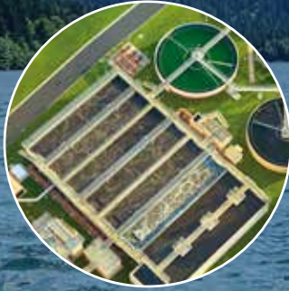
Atıksu Arıtma Sistemleri