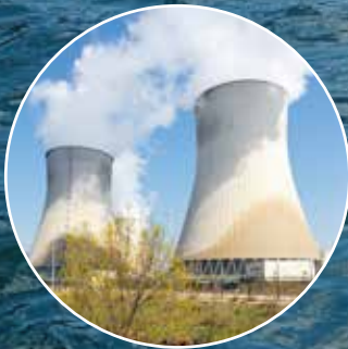
Su Şartlandırma Kimyasalları