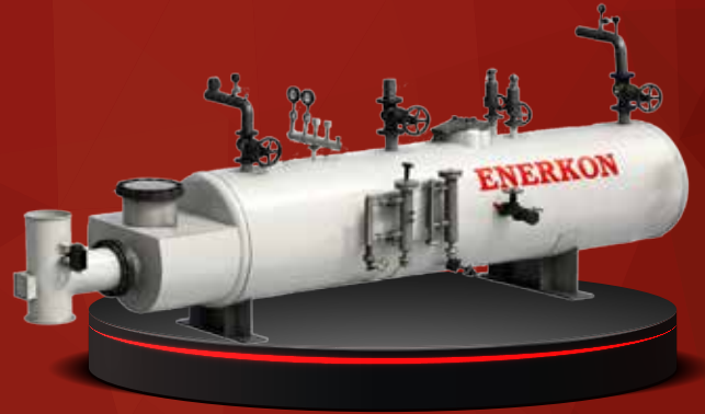
ATIK ISI KAZANI