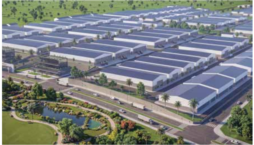
Adana İhtisas Mobilya Sanayi Sitesi (ADAMOS), üreticileri modern ve planlı bir alanda bir araya getirerek sektörde verimlilik, kalite ve rekabet gücünü artırmayı amaçlayan organize bir sanayi projesi olarak öne çıkıyor.

Projenin temellerinin 2018 yılında, dönemin Adana Valisi Mahmut Demirtaş ile gerçekleştirilen kritik bir toplantıda atıldığını ifade eden Bildırcın, o süreçte sektörün içinde bulunduğu dağınık ve verimsiz yapının tüm yönleriyle ele alındığını belirtti. Mobilya üreticilerinin büyük bölümünün küçük, sağlıksız ve altyapı açısından yetersiz alanlarda faaliyet gösterdiğine dikkat çeken Bildırcın, bu durumun hem üretim kalitesini hem de sektörün rekabet gücünü olumsuz etkilediğini vurguladı. Vali Demirtaş ile yapılan görüşmede, mobilyacıların artık ihtisaslaşmış, modern ve planlı bir üretim alanına duyduğu ihtiyacı açık bir şekilde dile getirdiklerini aktaran Bildırcın, sürecin sadece masa başında