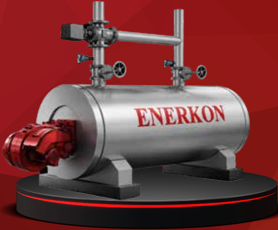
SICAK SU KAZANI